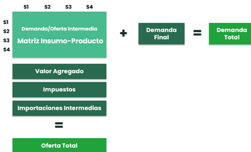
Figura 2 | Representación esquemática de la matriz regional cerrada.

Finalmente, una vez completadas las etapas metodológicas subsiguientes, estos datos permitirán construir la matriz regional cerrada. Para la calibración de la matriz se impondrá la igualdad entre oferta y demanda totales en todos los sectores, validando así la consistencia interna de la estimación.